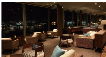
23階 <23rd floor> スカイラウンジ トップオブヒロシマ TOP OF HIROSHIMA Sky Lounge