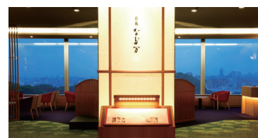
20階 <20th floor> 広島 那だ万 NADAMAN Japanese Restaurant

営業時間や内容などの変更を行わせていただいております。最新の情報はこちらからご確認ください。