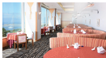
21階 <21st floor> 中国料理 李芳 Riho Chinese Restaurant