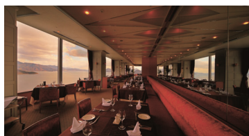
22階 <22nd floor> ステーキ&シーフード ボストン Boston Steak & Seafood Restaurant